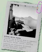
Alto Cerro San Juan de los Rios, San Juan, 1929-1930 Buenos Aires, 1930-1931 Colección de la familia Tardieu Arilla Museo de Historia de Buenos Aires Buenos Aires, 2006