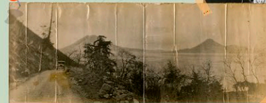
Alto Cerro San Juan de los Rios, San Juan, 1929-1930 Buenos Aires, 1930-1931 Colección de la familia Tardieu Arilla Museo de Historia de Buenos Aires Buenos Aires, 2006

Para demostrarlo, el aviador cuenta cómo ha presentado a diferentes personas un extraño dibujo, cuya forma queda abierta a la interpretación. La figura y su posterior explicación sirven como marco para que el narrador muestre la importancia de observar la realidad con ojos de asombro, abiertos a las emociones y la imaginación.