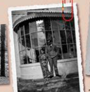
Antoine Suncín Consuelo Suncín con Antoine de Saint-Exupéry