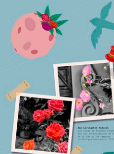
Antoine de Saint-Exupéry, El principito . Edición de la editorial del Principito. 1943. Foto de la colección de la editorial del Principito. 2019.

En sus páginas, el relato del aviador confronta constantemente a quien lee; lo obliga a hacerse los mismos cuestionamientos y lo invita a aprender las mismas lecciones.