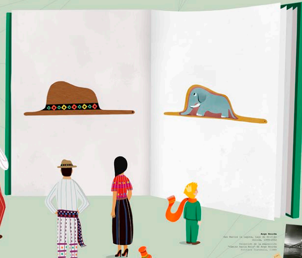
Alto Cerro San Juan de los Rios, San Juan, 1929-1930 Buenos Aires, 1930-1931 Colección de la familia Tardieu Arilla Museo de Historia de Buenos Aires Buenos Aires, 2006